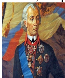
А) А.В. Суворов

20. Посмотрите на портреты и выберите имя великого русского полководца XVIII века, который не проиграл ни одного сражения. -