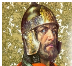
В) Александр Невский