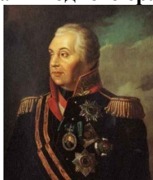
Б) М.И. Кутузов